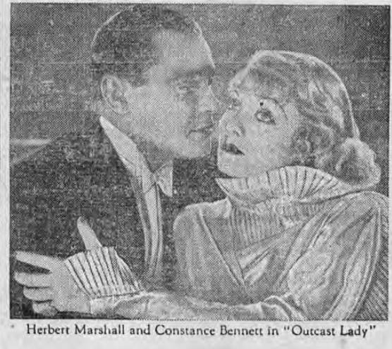
Herbert Marshall and Constance Bennett in "Outcast Lady"