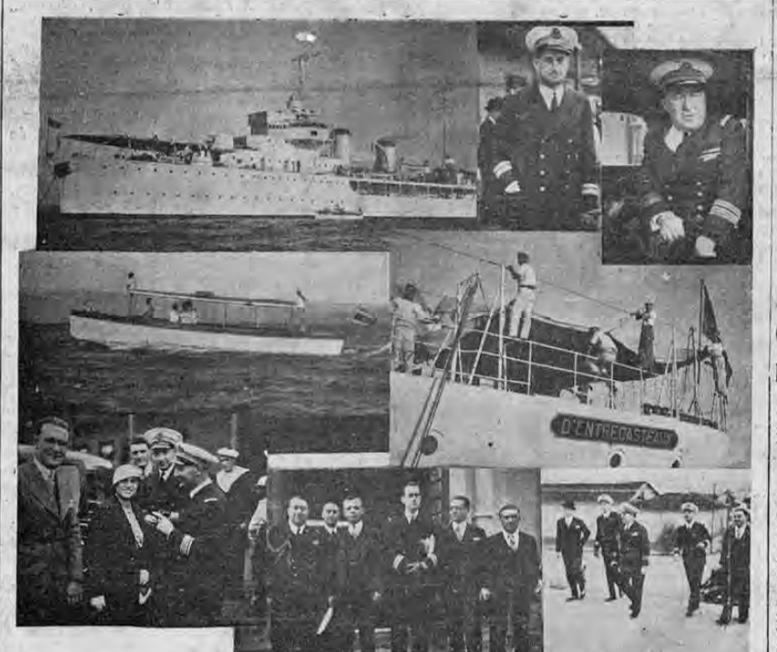
Parte superior del grabado: izquierda, el aviso francés "D'Entrecasteaux", llegando a Puntarenas; derecha, el capitán del barco y el agregado naval a la legación francesa en Costa Rica, M. Sablé. Centro: izquierda, la lancha de la capitania llevando las autoridades del puerto a bordo del aviso, antes de atracar;

Entre los señores diputados se comentan con gran interés, en todos estos días, las bases del proyectado arreglo de límites con Panamá.